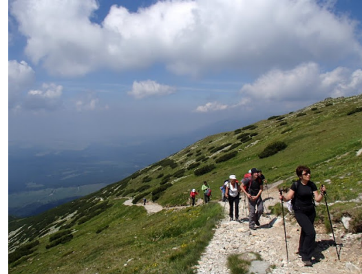
Konačno izađosmo iz šume