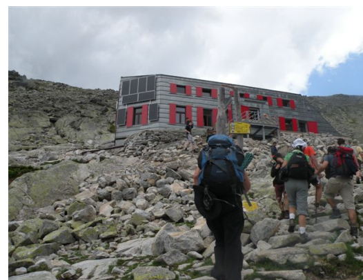
Dom na najvećoj visini u Slovačkoj-2250m

Grmljavina koja se približavala požurivala nas je sa vrha ka domu, gde smo napravili dužu, zasluženu pauzu. Biti u planinarskom domu Slovačke, a ne probati buhtle, bila bi prava šteta. Istom stazom se vraćamo do busa i Popradskog plesa, gde sačekujemo grupu koja je preko Hincovog plesa popela Koprovski štít (2363 m). Hincovo pleso je najveće jezero u Tatrama, pa ga zbog talasa koje stvaraju vetrovi, nazivaju Hincovim morem. U povratku ka Lehoti, obišli smo Poprad, najveći grad ispod Tatri. Još jednu noć smo proveli u interesantnom zamku. Naredni dan je bio planiran za povratak. Opraštamo se od ljubaznog domaćina i nastavljamo ka Budimpešti.