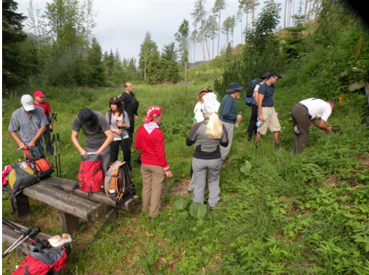
Tri studenca Polazna tačka za Krivan