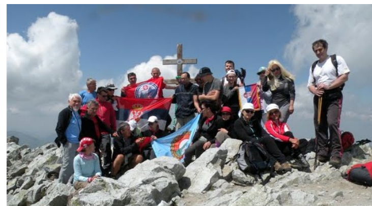
Grupa na vrhu