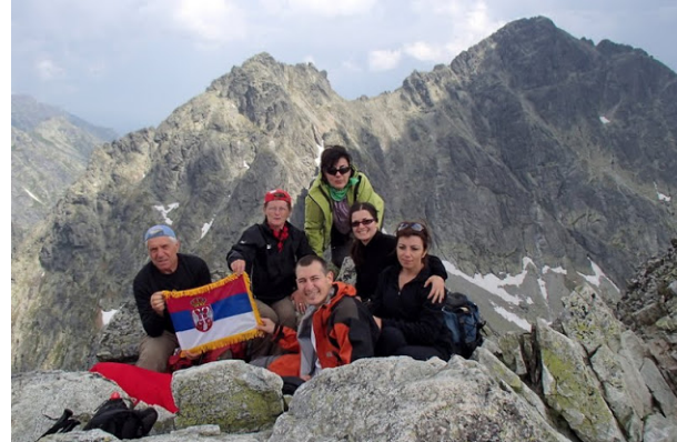
Na Koprovkom štitiu

Sutradan ustajemo po planu i autobusom stižemo do Popradskog plesa (1500 m). Nakon kratkog ubeđivanja sa domaćinima planinarskog doma, uspele smo da okrenemo autobus da ga ne bismo vozili unazad najmanje pet kilometara. Prepoznatljivom stazom započinjemo uspon na Risi i Koprovski štít. Već posle pola sata uspona, grupa se razdvaja na dva dela. Sa Goganom polaze oni planinari koji su prošle godine bili na najvišem vrhu Poljske, na Koprovski štít. Drugi, veći deo grupe, krenuo je na najviši vrh Poljske, Risi. Markiranom stazom, preko Žabljeg jezera, stižemo do planinarskog doma na najvišoj visini (2225 m) u Slovačkoj. Odmaramo se i sakupljamo snagu za završni uspon na najviši vrh Poljske, koji se nalazi na granici Slovačke i Poljske. Imamo sreću sa vremenom, jer nas je na vrhu dočekalo sunce.